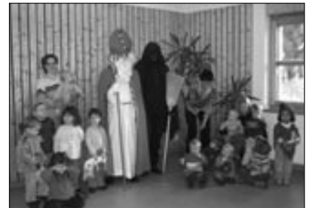
Freudige Gesichter beim Besuch des Nikolaus

Grosse Augen machten die Kinder, als plötzlich Nikolaus und Schmutzli mitten im Gemeindesaal standen. Der Nikolaus überreichte jedem ein kleines Geschenk, welches die Kinder mit strahlenden Gesichtern entgegennahmen. (kawe)