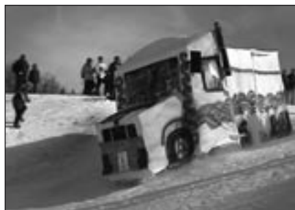
Der Schlitten Gotthard auf der Überholspur (Special Trophy 2002)

Am Sonntag, 9. März 2003 erfolgt der Showdown zum verrücktesten Schlittelrennen im Wallis, der special trophy. Infos: Snowboardclub fun riders, 3935 Bürchen, http://www.funriders.ch .